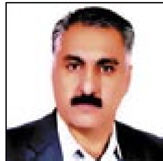
ئه كره مى ميهداد